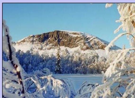
Hemsedalsrennet går i flotte omgivelser.

Start: Kl. 11 på turrennet. Disanserennet har klassevis fellesstart fra kl. 11:10. De yngste starter først.