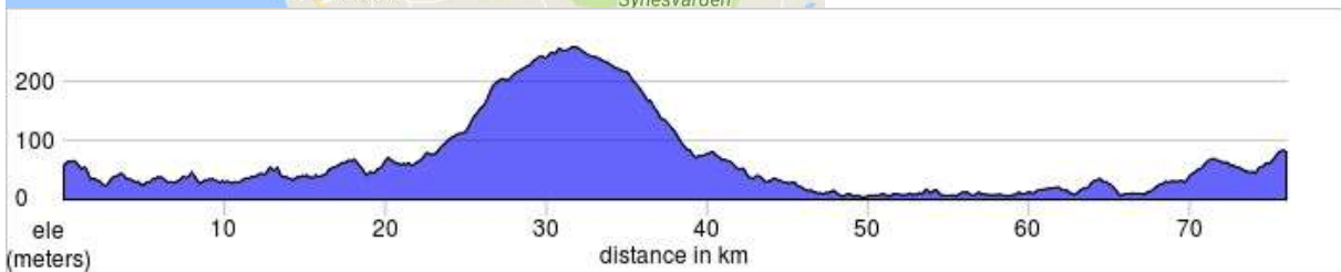
Kart over løypen og høyde meter