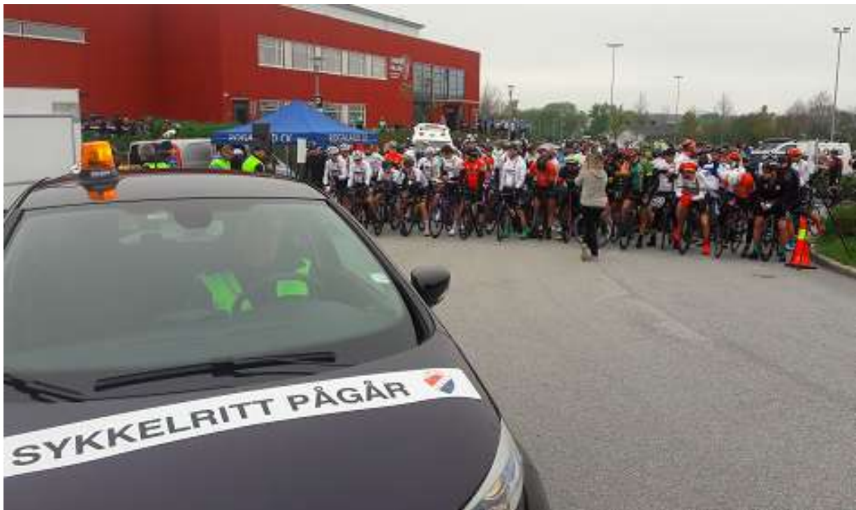
Klar til start.

Nytt i 2023 er at det settes en påmeldingsbegrensning på 500 deltakere. Så vær tidlig ute.